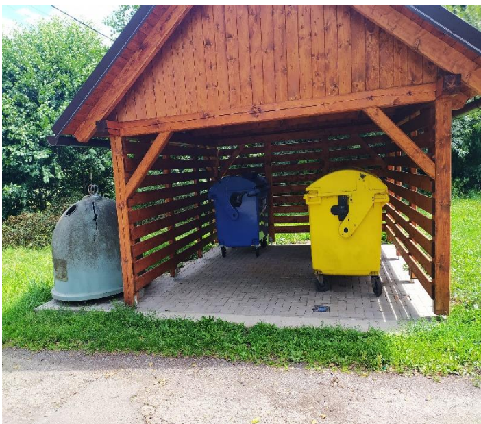
Nahrazený kontejner v přístřešku u hasičské zbrojnice